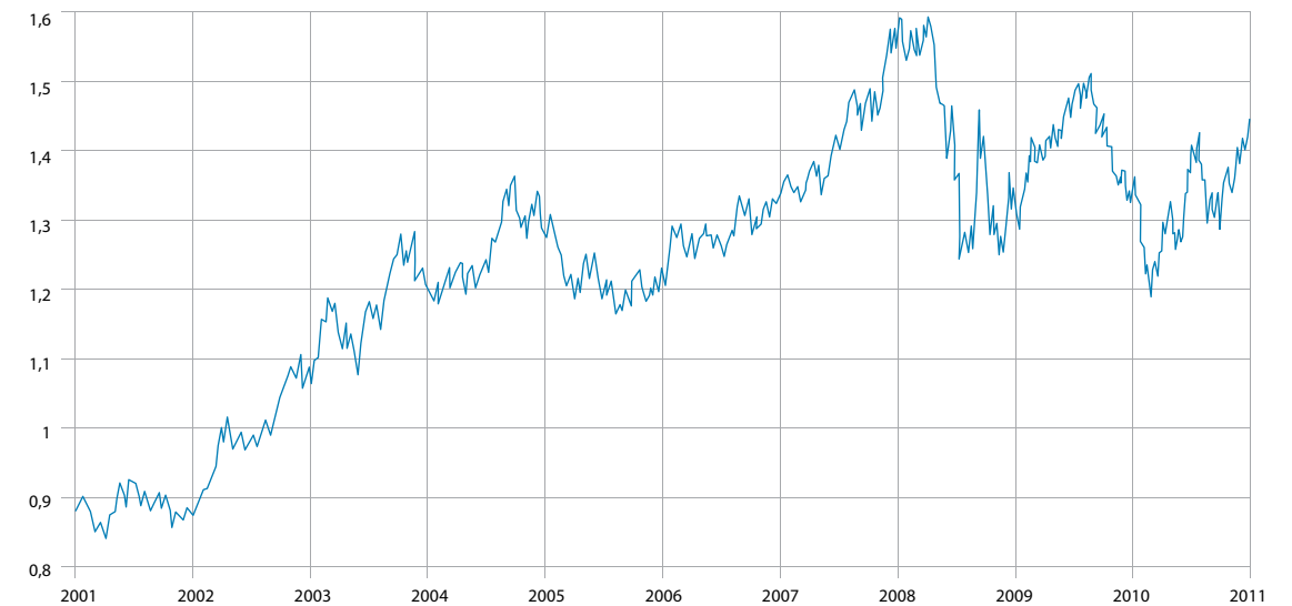
Таблица 2: Динамика курса евро к доллару