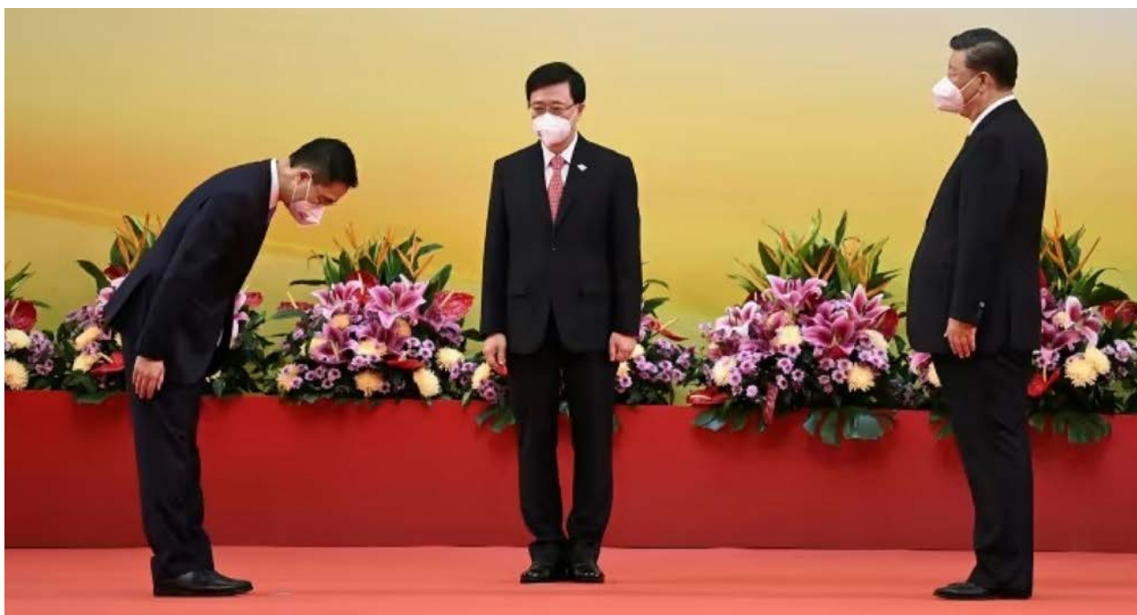
2 pav. Si Dzinpingas kartu su naujuoju Honkongo vadovu Džonu Ly priima kitų pareigūnų priesaikas.

Birželio 30 d. Kinijos vadovas Si Dzinpingas (Xi Jinping) su oficialiu dviejų dienų vizitu išvyko į Honkongą. Tai buvo pirmas Kinijos vadovo vizitas ne žemyninėje Kinijoje po daugiau nei 2 metų pertraukos, o pačiame Honkonge jis paskutinį kartą buvo lankęsis prieš 5 metus. Pagrindinis šio vizito tikslas – dalyvauti Honkongo grąžinimo Kinijai 25-mečio iškilmėse. Iškilmėse Dzinpingo sakytos kalbos 6 tikslas buvo išaukštinti Kinijos valdžios pasiekimus ir pastangas išlaikyti Honkongo klestėjimą ir stabilumą. Kalboje didžiausias dėmesys buvo skiriamas politikai „viena valstybė dvi sistemos“, jos efektyvumui ir svarbai. Ši frazė paminėta net 17 kartų. Kinijos prezidentas patikino, kad KLR yra pasiryžusi laikytis šios idėjos, kuri „jau parodė savo efektyvumą ir naudą skatinant Honkongo klestėjimą ir stabilumą“, principų, ir kartu reikalavo Honkongo valdžios „pateisinti gyventojų lūkesčius“. 25-mečio ceremonijos metu taip pat vyko šeštojo Honkongo specialaus autonominio regiono vyriausiojo pareigūno Džono Ly (John Lee Ka-chiu) inauguracijos ceremonija. Pagal Kinijos tradicijas, kaip teigia „Hong Kong Free Press“ 7 , po Dzinpingo vizito Honkongo vadovybė surengė daugiau nei 60 studijų sesijų, skirtų jo pasakytai kalbai analizuoti.